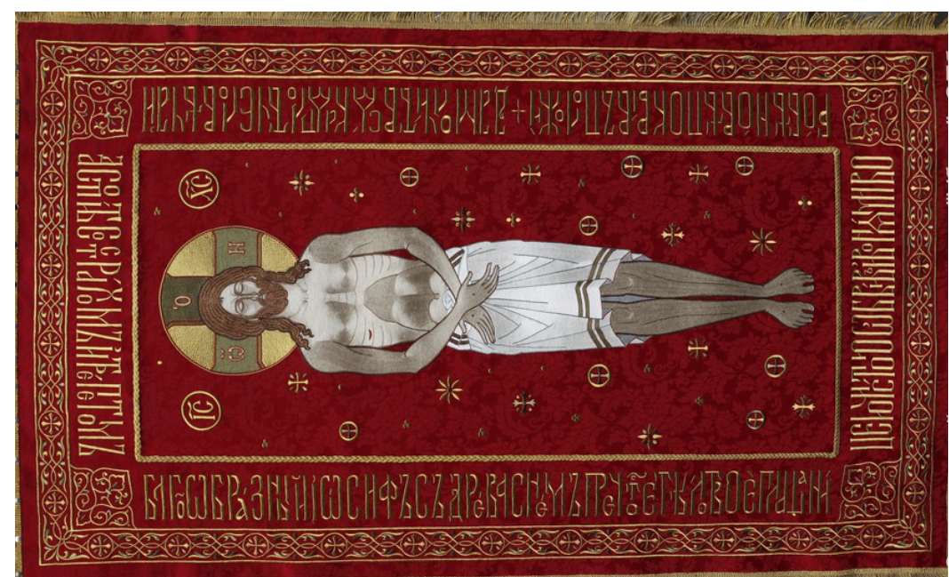
Господская плащаница. Мастерская «Убрус». Средник - ручная вышивка, кайма - машинная вышивка. (Санкт-Петербург) 2008 г.

На плащанице мастерской «Убрус» сохранилась прорись мастерской «Покров», но тело Спасителя обернуто тканью, в Византийском стиле, как на плащанице XV в., вклад великого князя Василия I.