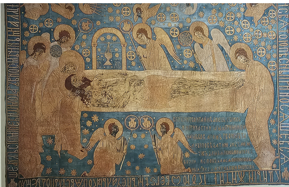
Плащаница. Вклад великого князя Василия I. Начало XV века.

Так, для создания вышитой плащаницы мастерской «Покров» послужила плащаница Милутина Урши в Крушеделе - самая ранняя из известных ныне плащаниц, которая хранится в Музее Сербской православной церкви в Белграде (размер 210 132 см). Она датируется примерно 1300 годом либо началом XIV века. Шитье выполнено в основном шелковыми и золотыми нитями, лишь некоторые детали серебром. В центре изображен умерший Спаситель. Его лик и тело вышиты по правильному рисунку тонким белым (выцветшим) шелком. Посредине тело Спасителя покрывает прямоугольный плат, украшенный вышивкой (крест, орнамент, кресты в кружках). Возле главы Спасителя вышиты два шестикрылых серафима, а по сторонам по три летящих ангела. Они восклицают: агіос (надписи вышиты рядом). Свободное поле плащаницы украшено крестами, звездами в кругах и цветами. Внутренняя кайма плащаницы состоит из орнамента с крестами в кругах. Композиция плащаницы необычна. Обычно Спаситель изображен так, будто зритель видит Его сбоку, а на этой плащанице зритель видит Спасителя сверху.