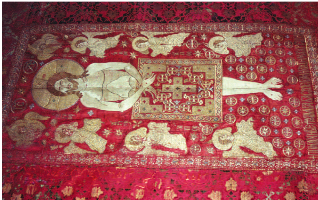
Плащаница Милутина Урши в Крушеделе. 210x132 см., началом XIV века.

В искусстве Древней Руси копирование было не просто обычным делом, но принципом, лучшие произведения становились образцами для мастеров, всем предлагалось им следовать. Отношение к церковному искусству на Руси никогда не было авторским, предполагалось, что это соавторство Богу, мастер молитвой, постом и очищением от страстей старался приблизиться к Нему и тем совершенствовать свое искусство. Чудотворные образы очень часто копировались и чем ближе они были к оригиналу, тем становились ценнее. Но в церковном шитье фотографическая точность невозможна, как неповторим и индивидуален каждый мастер, так неповторимо и индивидуально каждое произведение. Даже один мастер не может сам себя скопировать. Современные мастера стараются не создавать вышитых копий известных икон, а создавать их в других материалах и колорите.